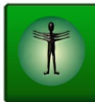
Khydra Serviços de Bancos de Dados