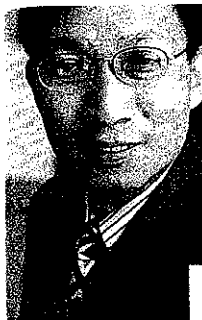
Minxin Pei. A sinistra: una foto di Ma Liang da "Book of taboo"

Uno sguardo più attento all'economia cinese in generale, e alla risposta del governo alla crisi economica in particolare, dovrebbe farci riflettere attentamente se sia davvero il caso di riporre in Pechino le nostre speranze di salvezza. L'economia cinese molto probabilmente non riuscirà a raggiungere una crescita degna di nota nel 2009, come sarebbe un 7 o 8 per cento, ci stupirà invece per la sua persistente debo-